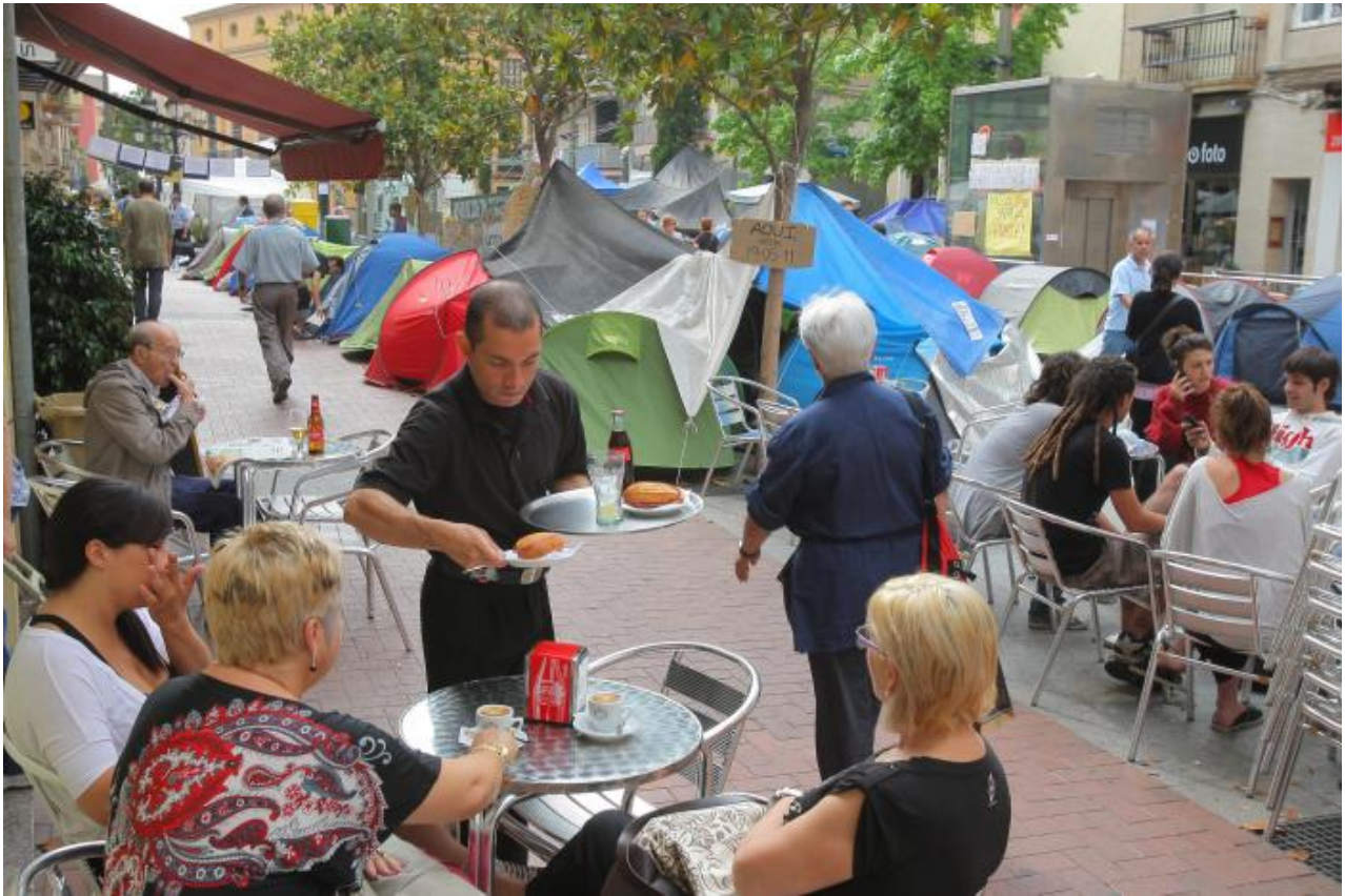
Café a la terrassa amb els indignats de fons.