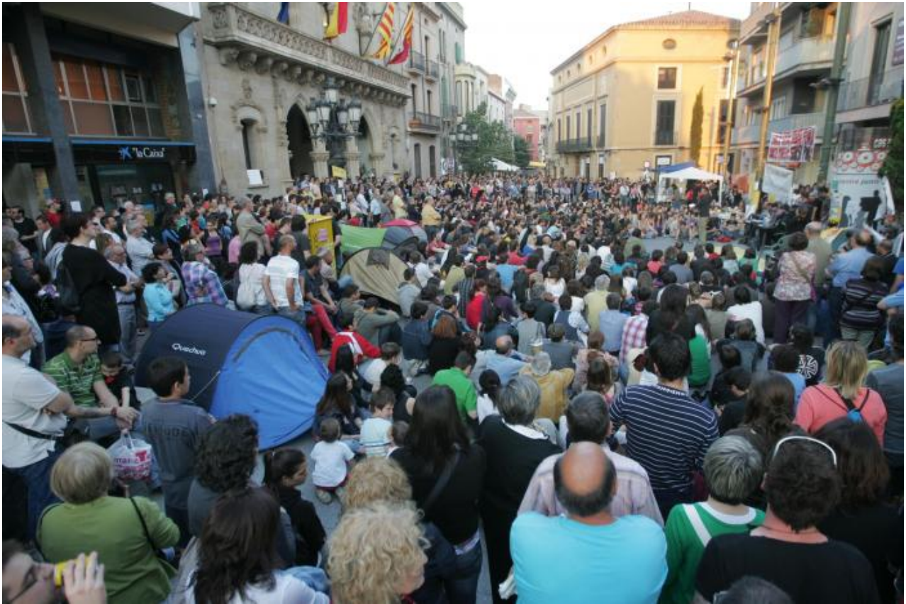
El Raval de gom a gom el maig de 2011.