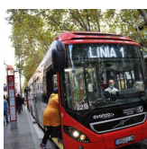
El tram tallat de la rambla d'Ègara es reobrirà divendres