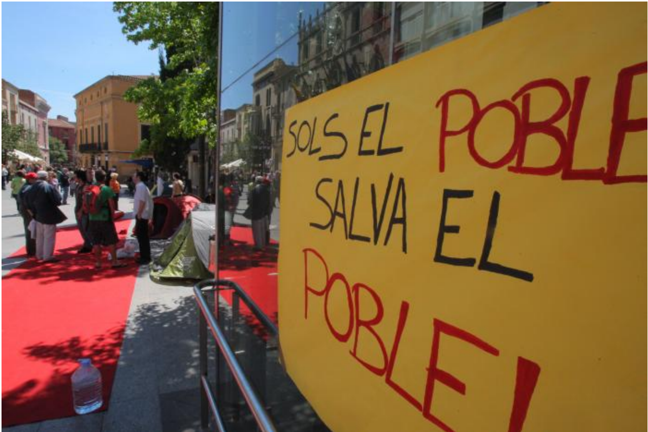
Una de les pancartes dels indignats.