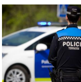
Denuncien dues persones per tinença de drogues i una per apropiar-se dos mòbils