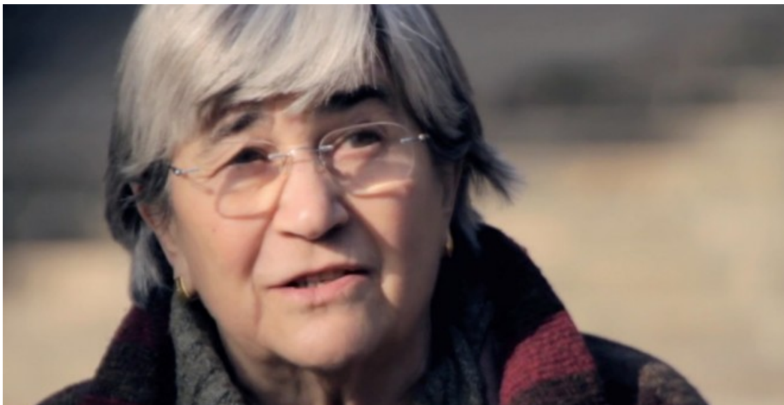
Miren Etxezarreta (Ordizia, 1936)

La Catedrática de Economía Aplicada reflexiona sobre el momento económico, político y social. Precursora de la antiglobalización, activista anticapitalista, Etxezarreta advierte de que “el problema de quienes han elaborado a partir del 15M es que han entrado en la dinámica del capitalismo que queremos cambiar”.