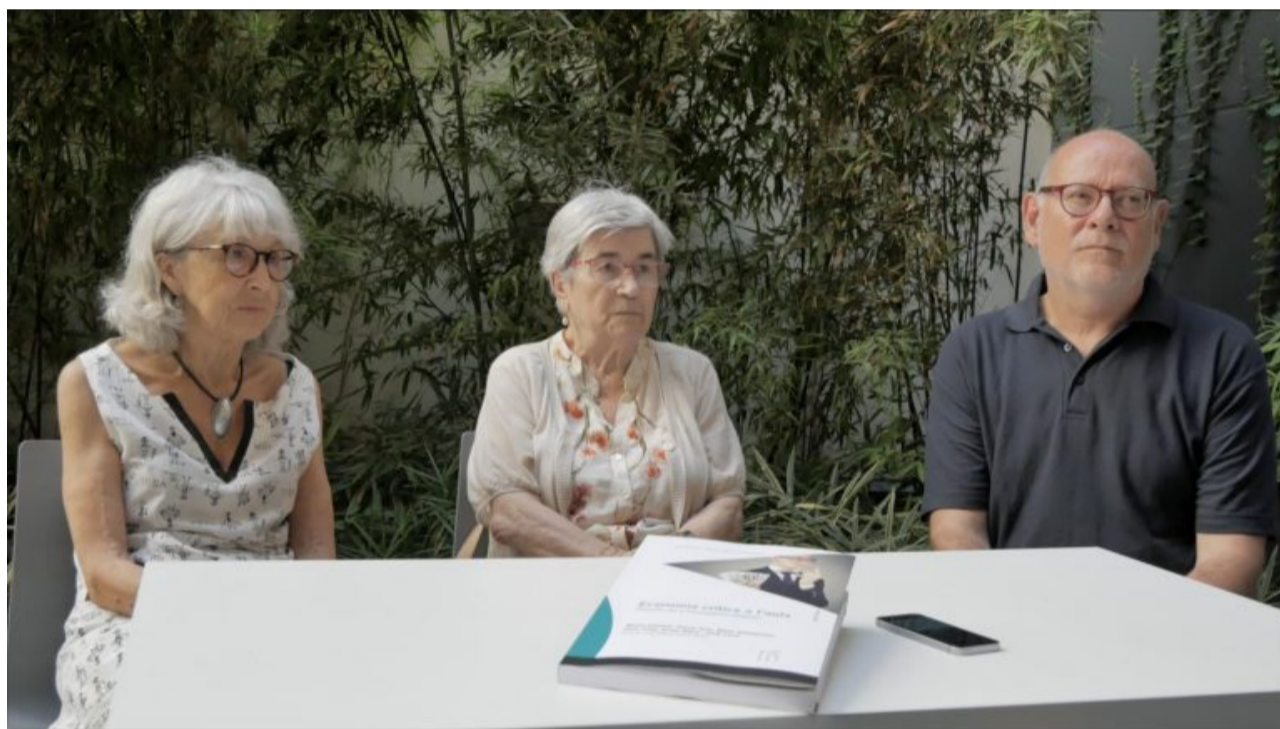
Autors: Kevin Bran i Gerard Marinello

"El capitalisme està descobrint com explotar la gent sense assalariar-la"