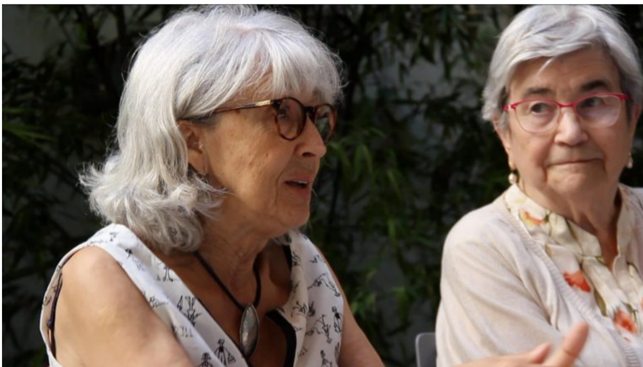
Autors: Kevin Bran i Gerard Marinello

MC: En el capitalisme hi ha l'Estat, i totes les institucions de l'Estat tenen com a funció donar suport a l'acumulació de capital i legitimar la pròpia existència del sistema enfront de la població. I això passa des que el capitalisme és capitalisme, i ha aconseguit fer creure a la gent que el que tenim és un sistema políticament igualitari, encara que d'igualitari no en tingui res.