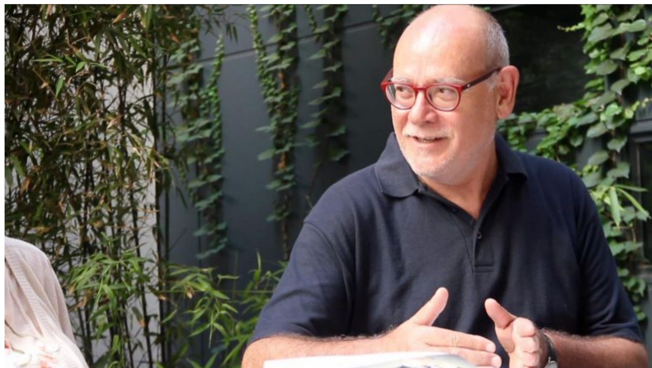
Autors: Kevin Bran i Gerard Marinello

Sí. Economia crítica és un llibre per a quixots perquè s'enfronta a molins de vent. És un intent de penetrar en la realitat d'allò que està passant per desmitificar-ho. Des d'Economia crítica intentem oferir un seguit de pautes per desvetllar les interpretacions que venen dels poders polític i econòmic.